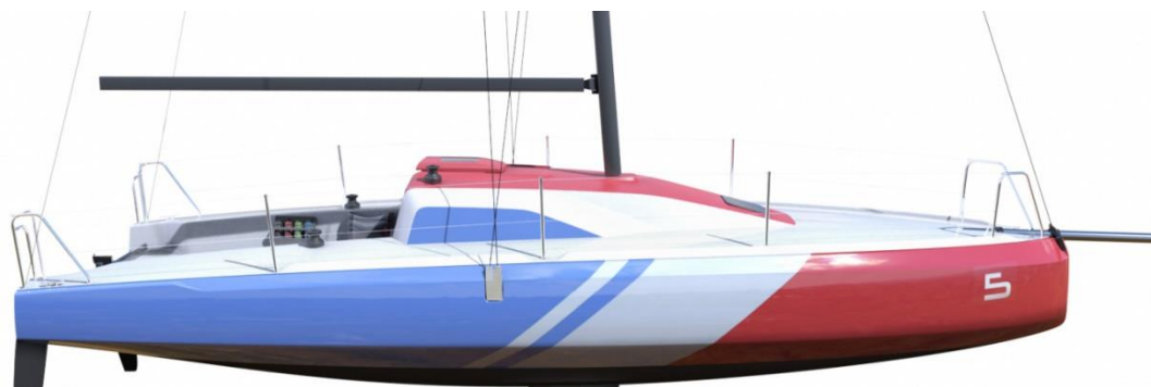
Le C 30 One Design